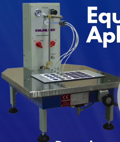
Dosadora T10M para Resina PU