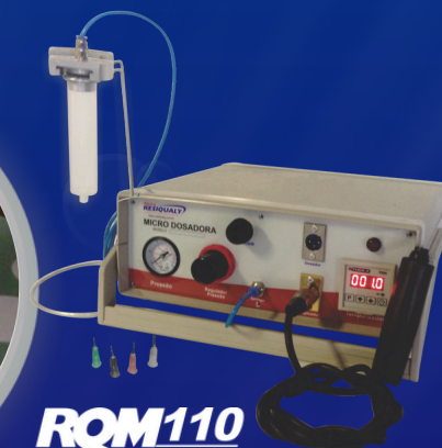
ROM110 MICRO DOSADOR

Equipamento de dosagem e aplicação de resina com controlador de programação de dosagem e intervalo de trabalho de fácil manuseio.