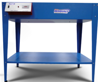
ROM700 MESA TÉRMICA

Estufa de alto desempenho com controlador digital para cura de peças ou etiquetas em resina, acelerando o processo. Com amplo espaço interno, possui sistema de circulação de ar para cura homogênea e pés nivelados para ajustes de piso.